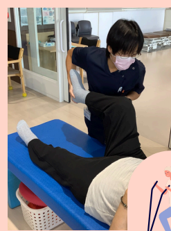
・ボディチェック